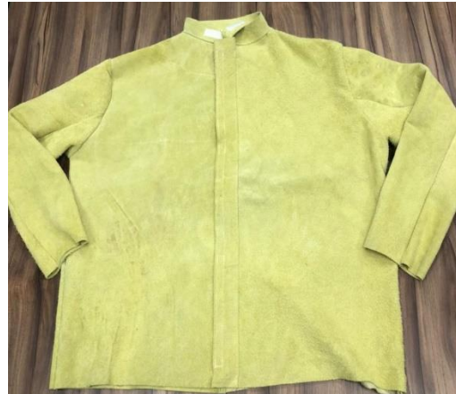
Vista de frente ↑.