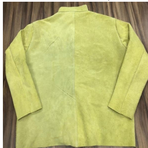
Vista del dorso ↑