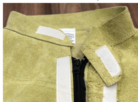
Vista cuello 2 ↑.