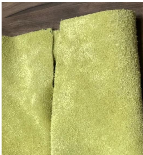
Vista de la manga ↑.