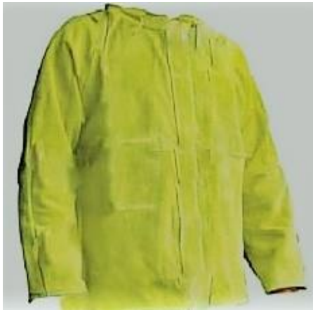
Vista del general ↑.