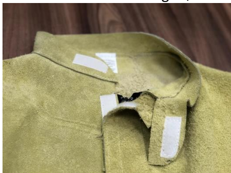
Vista cuello 1 ↑.